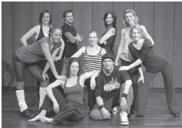
Die Studierenden der Tanzklasse brauchen den Vergleich mit Profis nicht zu scheuen.