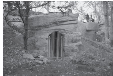
Nach der Fertigstellung ist der Südeingang wieder in das Gelände eingebettet und wird bald begrünt.