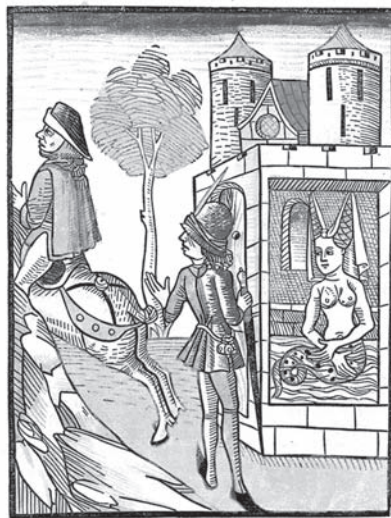
Raymond überrascht Melusine beim Baden und entdeckt ihren Schlangenleib. Illustration aus der Erstausgabe der Melusine: Bernhard Richel, um 1473/74, Basel.

Wie reymund melusinen im bad sach vnd er zū moll vñel erkent vñ in großem zorn sinen brüder vñ yme lebichte wan er yme argel von melusinen leit/das er aber nit bekunden hant