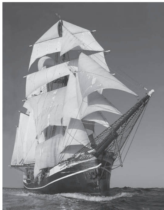
Auf dem frisch renovierten Traditionsegler „Thor Heyerdahl“ können die Schüler auf Weltreise gehen.