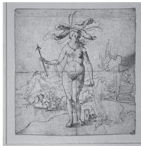
Hans Leu der Jüngere: Venus (Allegorie auf die Vergänglichkeit).

Viele deutet darauf hin, dass die Sammlung im 17. Jahrhundert in Nürnberg zusammengeführt und nur wenig später von einem Ansbacher Markgrafen für seine Kunstkammer erworben wurde. Nach der Abdankung des letzten Markgrafen im Jahre 1791 fielen die beiden Fürstentümer und damit auch die Kunstschatze an den König von Preußen. Der machte im Jahre 1805 die Ansbacher Hofbibliothek, zu der auch die Sammlung gehörte, seiner neuen Universität zum Geschenk.