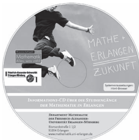
Mathe gibt Schwung - dieses Bild vermittelt die neue CD mit einem Motiv aus dem Jahr der Mathematik.

Auf der CD findet man fünf große Kapitel. Informationen zum Studium werden geliefert und Studiengänge vorgestellt. Danach wird das Interesse an der Mathematik thematisiert und auf die Mathematik im Mathematikstudium eingegangen. Auf die Schilderung verschiedener Berufsbilder folgt die Frage „... und nach dem Studium?“ Die Unterlagen sind auf aktuellem Stand und bieten angehenden