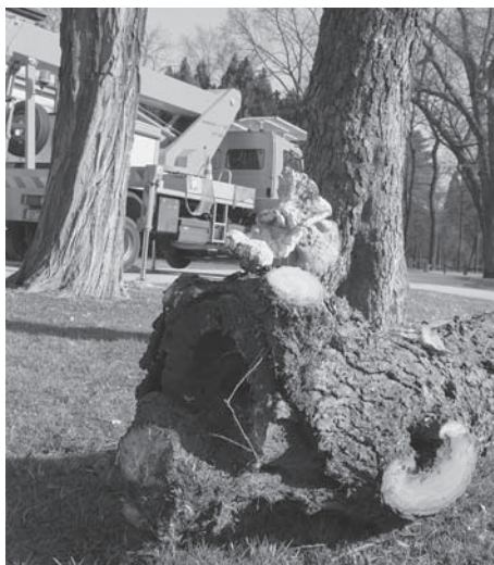
Hier war der Pilzbefall so weit fortgeschritten, dass der Baum nicht mehr zu retten war.

Trieben sich etwa kanadische Holzfäller in Erlangen herum? Wer Ende Februar durch den Schlossgarten spazierte, wurde Zeuge, wie an die Stämme von großen Bäumen die Säge angelegt wurde. Tatsächlich waren Mitarbeiter der Abteilung Stadtgrün der Stadt Erlangen am Werk, die mit ihrem Einsatz Parkbesucher vor Risiken bewahrten. An 35 Bäumen waren die Schäden im Laufe der Jahre so groß geworden, dass sie ohne Vorankündigung umzustürzen oder die Kronen bzw. Teile davon plötzlich zu verlieren drohten.