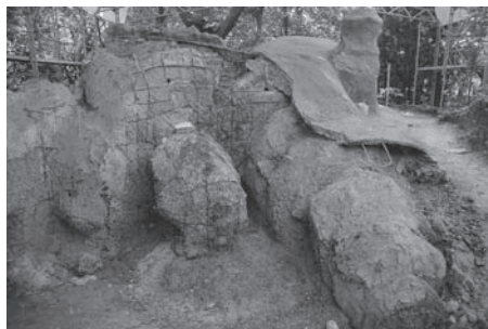
Als Trümmerhaufen präsentierte sich die Neischl-Höhle während der Instandsetzung.

Nicht ganz fertiggestellt ist das Innere der Grotte: Noch fehlt es an Finanzmitteln.