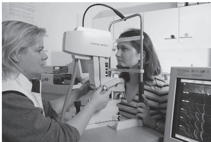
Neue Methoden zur Untersuchung des Augenhintergrunds verhelfen dazu, dass Durchblutungsstörungen der Netzhaut besser behandelt werden können.

Die Forschergruppe mit dem Titel „Endorganschäden bei arterieller Hypertonie: Pathogenetische Bedeutung von nicht-hämodynamischen Mechanismen“ (KFO 106) konnte in allen drei Bereichen Aspekte des Krankheitsbilds genauer fassen, die nicht