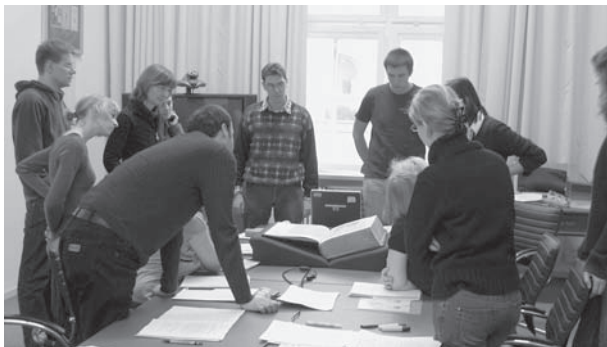
Studium von Handschriften in der Bayerischen Staatsbibliothek in München.