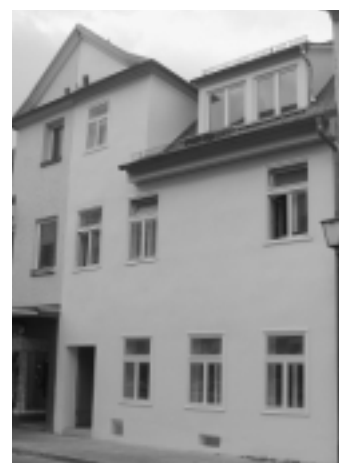
Eines von drei ausgezeichneten Häusern: Das Haus Wasserturmstraße 6 in Erlangen.

Architektin Christa Baumgartner, mit der die Universität mehrfach erfolgreich zusammengearbeitet hat, gelang es, innerhalb eines Jahres und im Rahmen der veranschlagten Kosten, das Gebäude preiswürdig zu restaurieren.