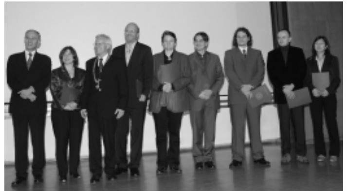
Urkunden und ein Scheck für die Besten: Die Habilitationspreisträger, die beim Dies academicus 2004 ausgezeichnet wurden.