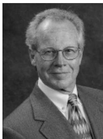
H. C. Recktenwald-Preisträger Oliver E. Williamson von der University of California, Berkeley

Der Preisträger ist (Mit-)Herausgeber verschiedener Fachzeitschriften wie dem Journal of Law, Economics, and Organization, dem Journal of Economic Behavior and Organization sowie dem Journal of Accounting, Auditing, and Finance. Er war Vize-Präsident der American Economic Association in 2001, Präsident der Inter-